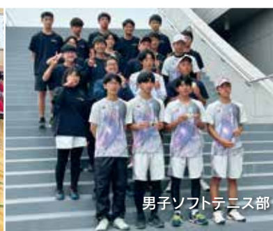
男子ソフトテニス部