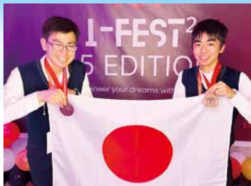
日本代表として世界大会出場