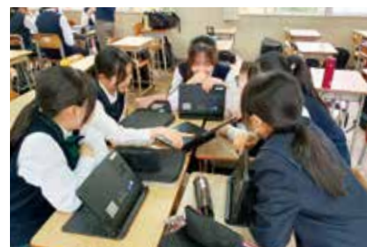
ICTを活用した調べ学習と話し合い