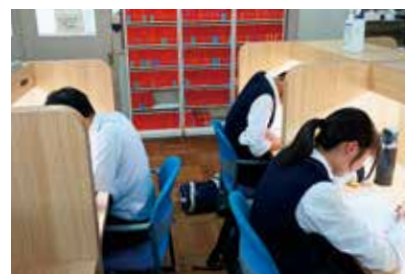
充実した学習環境