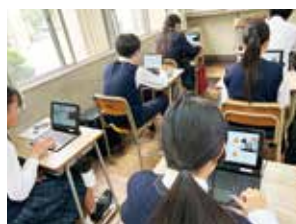
オンライン英会話