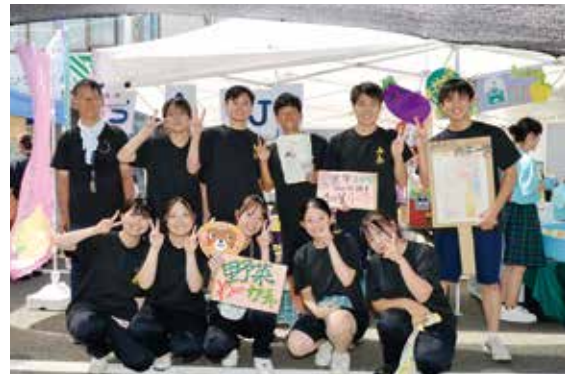
全国「商い甲子園」(高知県知事賞)