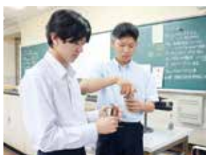
マルチサイエンス