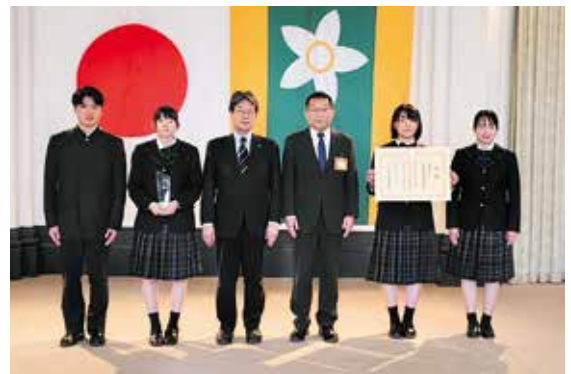
ソーシャルチャレンジランプリ(愛媛県知事賞)