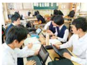
ベーシックサイエンス